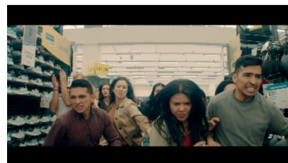
COMERCIAL / VIDEOCLIP